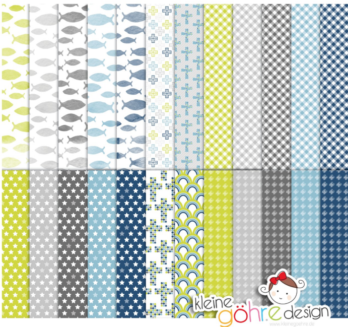
digitale Papiere "Taufe Kreuze blau grün"