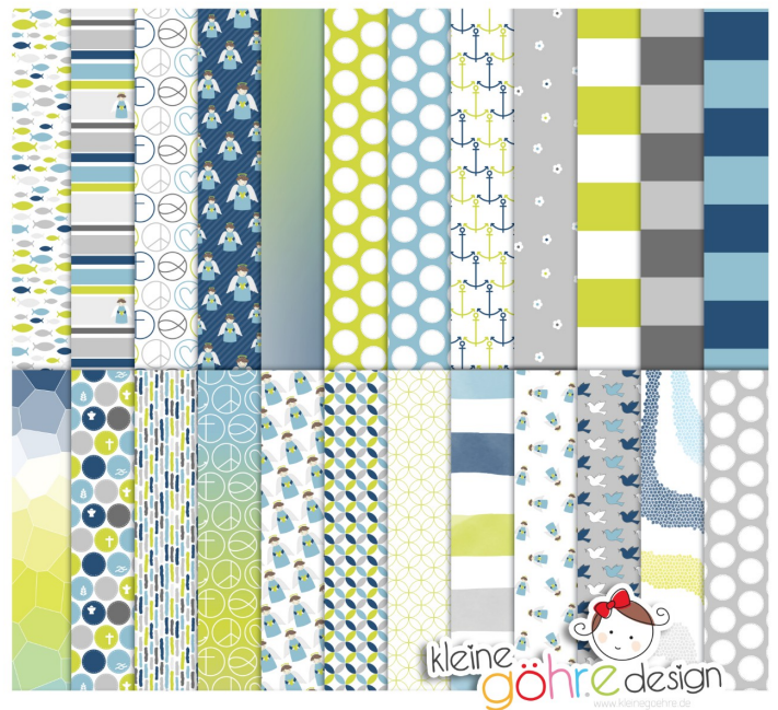
digitale Papiere "Taufe Muster1 blau grün"